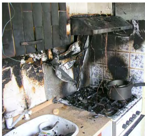
Obr. Požár v kuchyni

Domácí únikový plán (DÚP) je předem smluvený způsob úniku či opuštění objektu (bytu, domu) v případě požáru. Zpravidla se vypracovává několik únikových cest a slouží k včasnému a bezpečnému opuštění ohroženého prostoru. DÚP by měl být znám všem členům rodiny a měl by být alespoň dvakrát ročně procvičován. Důležitou součástí DÚP je „ Místo setkání “ členů rodiny (u stromu na zahradě, u lampy pouličního osvětlení ...). Rodina má určeno „místo setkání“ mimo dům (např. u stromu před domem či jiný záchytný bod), kde se všichni sejdeme a odkud budeme volat hasiče. Lze tak získat přehled o všech členech rodiny v případě požáru a pomůžete tím také zasahující jednotce.