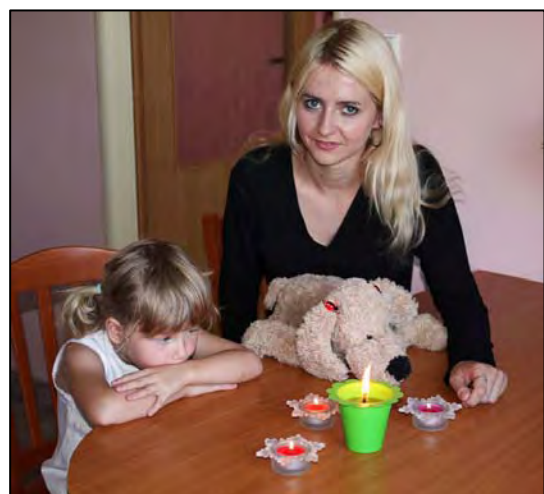
Obr. Svíčky neponechávejte bez dozoru

Nezapomeňte, že hořící svíčka nebo prskavka je otevřený oheň a s jako takovým by se s ní mělo zacházet. Ještě ve vzdálenosti 8-10 cm od plamene svíčky teplota dosahuje 200 °C , což stačí k zapálení papíru, plastů, textilií a dalších předmětů, které ponecháte v blízkosti hořící svíčky. Zapálenou svíčku proto nelze položit