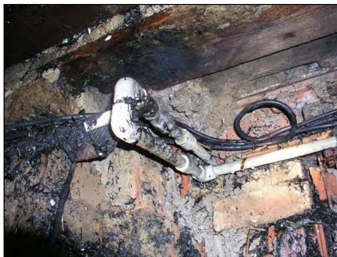
Obr.: Ohřev tohoto plastového vodovodního potrubí PB hořákem měl za následek požár rodinného domu.

Svařovat lze kovy železné (např. ocel), ale také neželezné (např. hliník a měď). Takzvaně svařovat lze však také plasty a lepenku. Samostatnou kapitolu v práci s otevřeným ohněm tvoří pokrývačské práce, při kterých dochází k manipulaci s hořlavými látkami (lepenkami), které se svařují například plynovými hořáky.