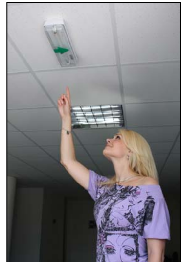
Obr. 4: Nouzové osvětlení.

Nejmenší šířka nechráněné únikové cesty je 550 mm a nejmenší šířka chráněné a částečně chráněné únikové cesty je 825 mm se šířkou dveří alespoň 800 mm.