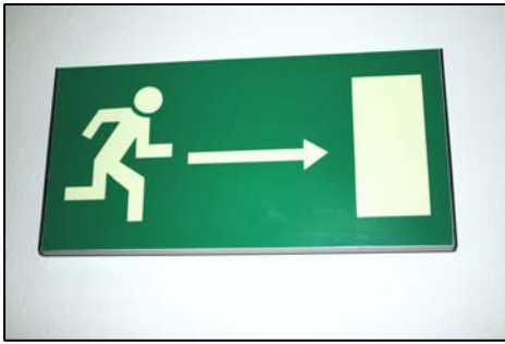
Obr. 3: Směr úniku osob.