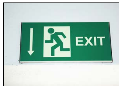
Obr. 1: Označení únikového východu.