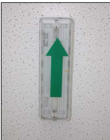
Obr. 5: Detail nouzového osvětlení.

Chráněné únikové cesty a všechny jejich součásti nesmí být využívány způsobem zvyšujícím požární riziko .