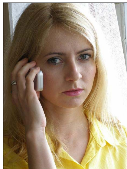
Obr. 2: Víte, co byste měli operátorovi sdělit?

Pokud zavoláte na špatné číslo, nic se neděje. Jednotlivé složky si volání předají mezi sebou. Jen budete muset třeba opakovat stejné informace, které jste již před chvílí říkali jinému operátorovi. To ale stojí drahocenný čas a záchranáři vyjedou později.