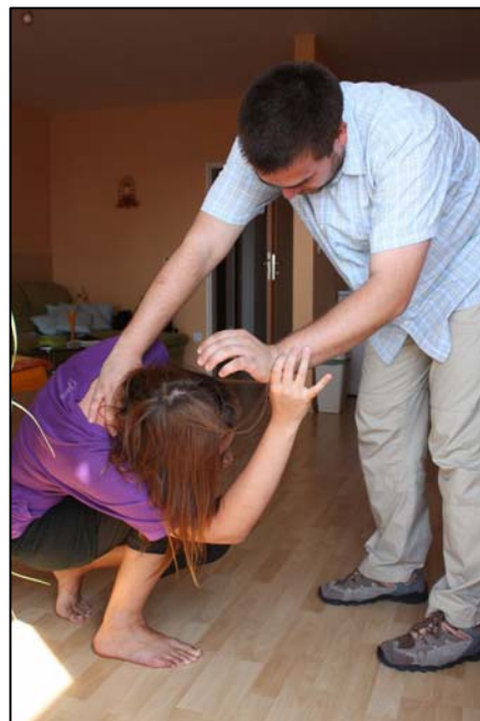
Obr. 1: Domácí násilí.

Domácí násilí není např.: „italská“ domácnost, jednorázový útok v afektu, násilí mezi osobami, které nesdílí bydlení.