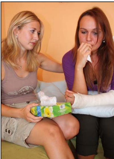
Obr. 2: Svěřte se přátelům.